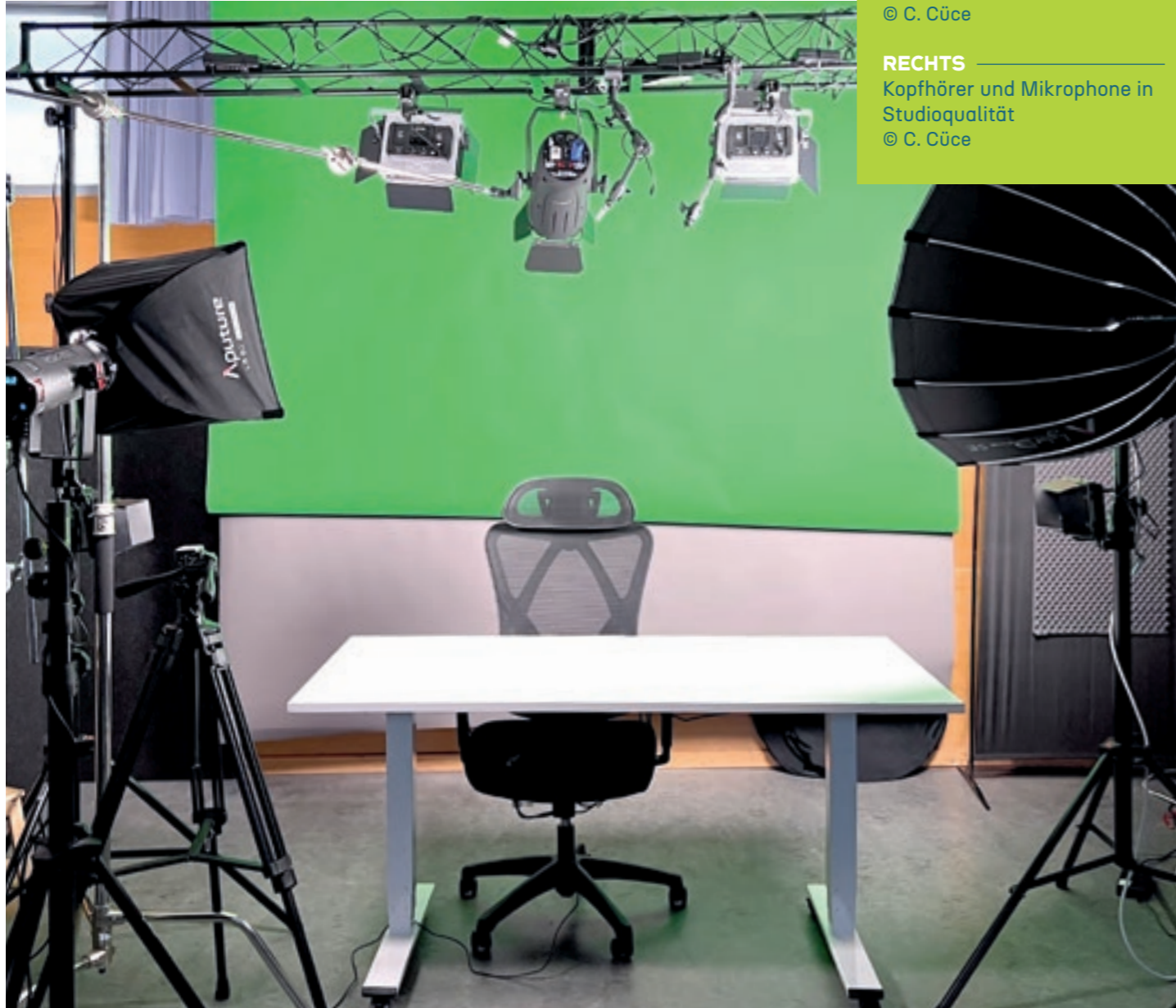
OBEN Einblick ins neue Medialab der Gretel